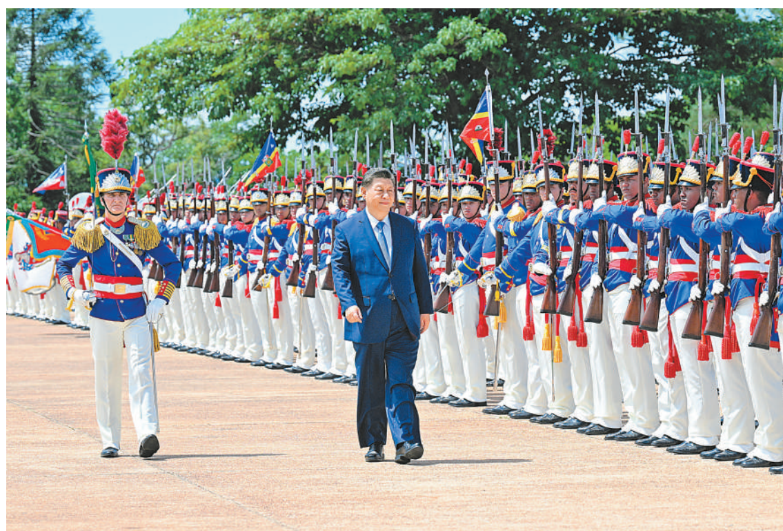
当地时间11月20日上午，国家主席习近平在巴西利亚总统官邸黎明宫同巴西总统卢拉举行会谈。会谈前，卢拉总统和夫人罗桑热拉热情迎接习近平，并为习近平举行隆重盛大欢迎仪式。