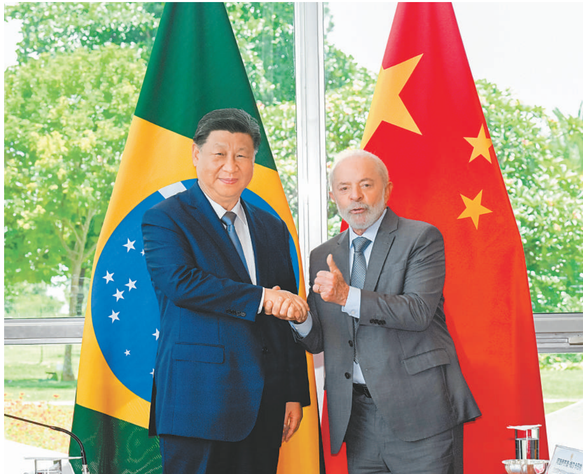
当地时间11月20日上午，国家主席习近平在巴西利亚总统官邸黎明宫同巴西总统卢拉举行会谈。