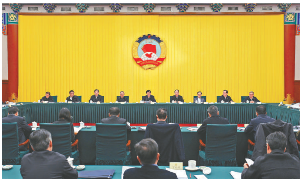
11月26日,十四届全国政协第二十六次双周协商座谈会在北京召开,中共中央政治局常委、全国政协主席王沪宁主持会议。

本报讯(记者 吕蕊)十四届全国政协第二十六次双周协商座谈会11月26日在京召开,中共中央政治局常委、全国政协主席王沪宁主持会议。他表示,中共十八大以来,以习近平同志为核心的中共中央把建设海洋强国作为中国特色社会主义事业的重要组成部分和实现中华民族伟大复兴的重大战略任务,坚持走依海富国、以海强国、人海和谐、合作共赢的发展道路,扎实推进海洋强国建设,引领我国海洋事业发展取得历史