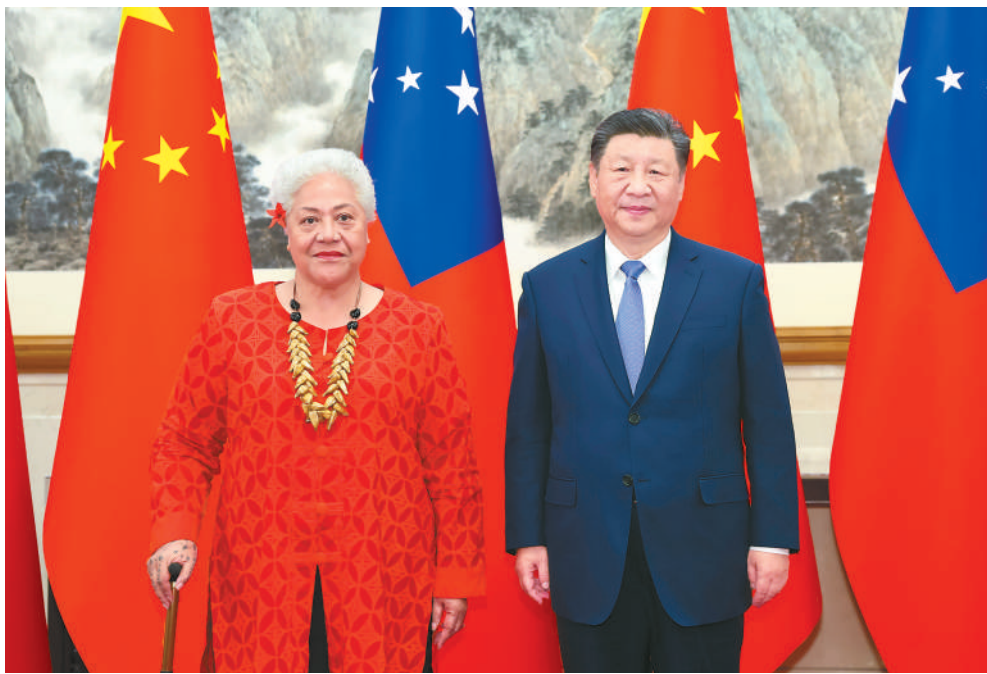
11月26日下午,国家主席习近平在北京钓鱼台国宾馆会见来华进行正式访问的萨摩亚总理菲娅梅。

新华社北京11月26日电(记者 冯敬文 曹嘉明)11月26日下午,国家主席习近平在北京钓鱼台国宾馆会见来华进行正式访问的萨摩亚总理菲娅梅。